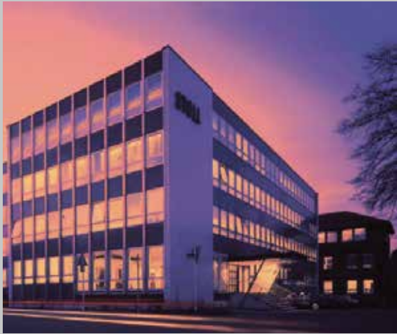
Headquarter der H. Stoll GmbH & Co. KG in Reutlingen